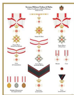
ORDINE AL MERITO MELITENSE