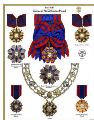
ORDINE DI PIO IX ORDINE PIANO