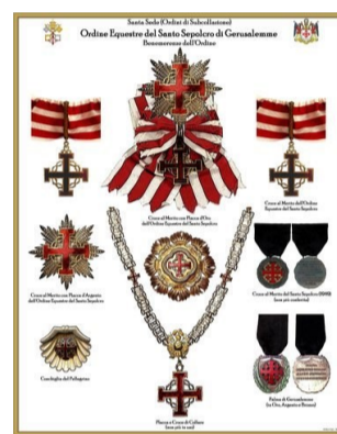
ORDINE DEL SANTO SEPOLCRO BENEMERENTE