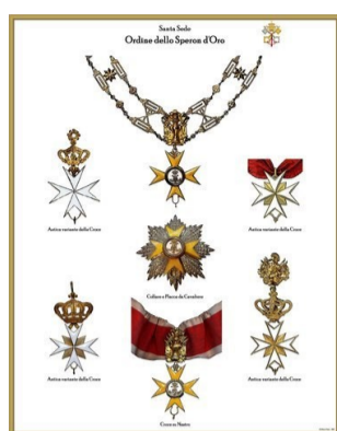
ORDINE DELLA MILIZIA AURATA