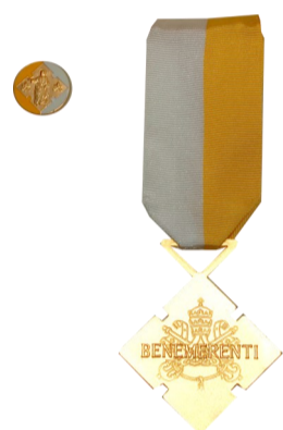
CROCE PRO BENEMERENTI