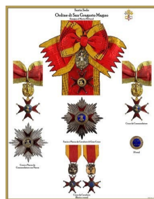
ORDINE DI SAN GREGORIO MAGNO