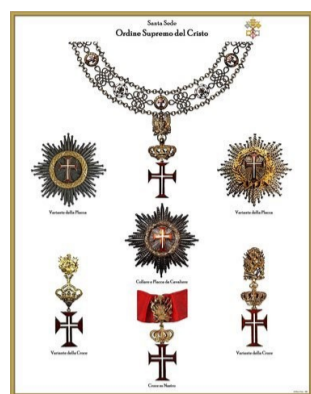
ORDINE SUPREMO DEL CRISTO