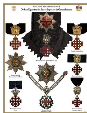
ORDINE DEL SANTO SEPOLCRO