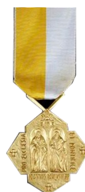
CROCE PRO ECCLESIA PONTIFICIA