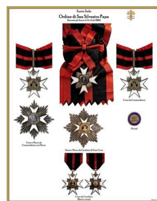
ORDINE DI SAN SILVESTRO PAPA